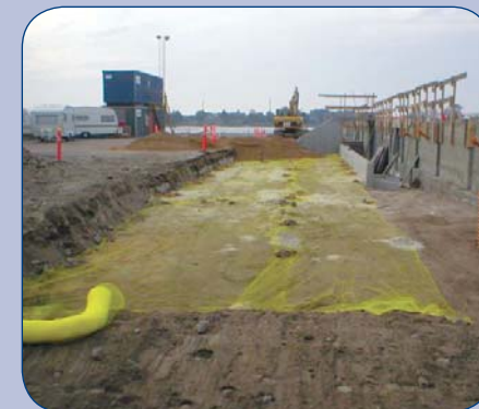
Boligbyggeri på havnefront