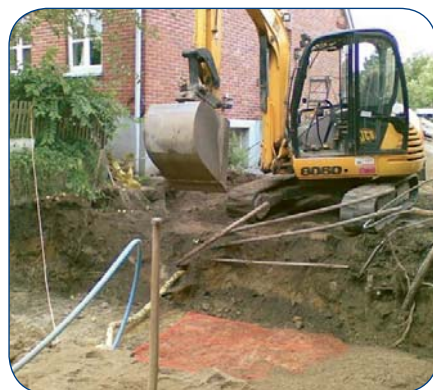
Værditabsoprensning på tidligere elværk