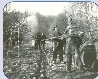
Sprøjtning med bly-arsen-forbindelser på frugtplantage for 1940